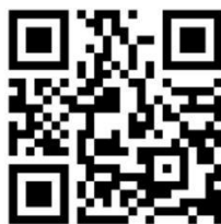
工作营课程【学员满意度调查表】 Student Feedback Form

课程结束后，学员可为课程打分，方式为扫描下方二维码，选择所学习的课程名称，进而进行评价